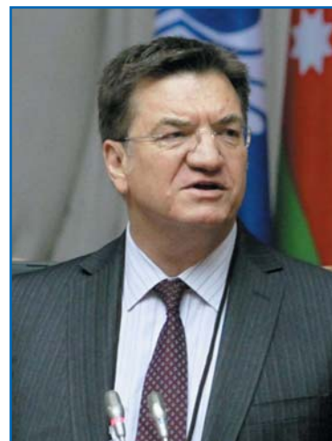
П. ЭФТИМИУ, Председатель Парламентской Ассамблеи Организации по безопасности и сотрудничеству в Европе

Господин председатель! Уважаемые коллеги!