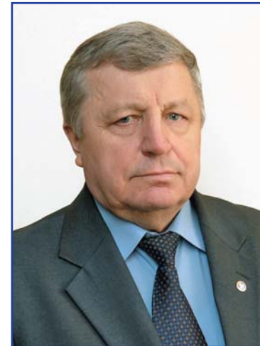
В. Г. ГАРКУН, первый заместитель председателя Исполнительного комитета — Исполнительного секретаря СНГ