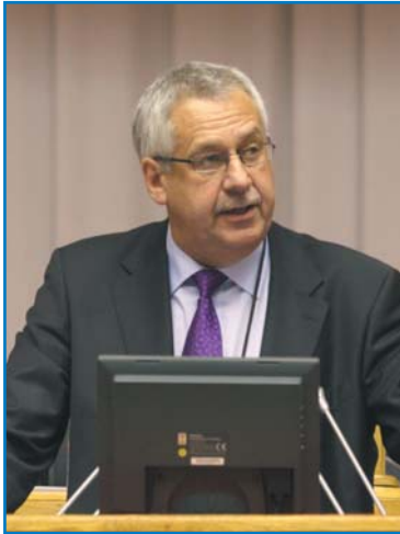
Х. К. ШМИДТ, министр транспорта Дании