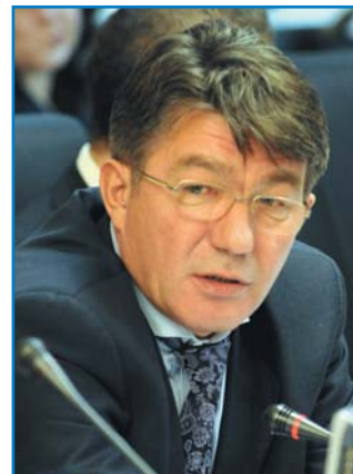
В. А. ОЗЕРОВ, председатель Комитета Совета Федерации Федерального Собрания Российской Федерации по обороне и безопасности