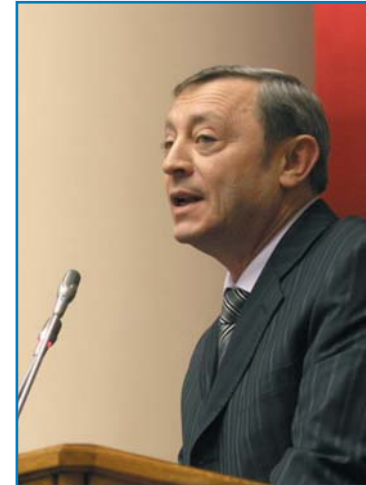
Л. Б. ПОЛЯК, начальник Главного управления безопасности дорожного движения Министерства внутренних дел Кыргызской Республики