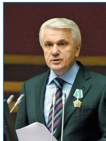
В. М. ЛИТВИН, Председатель Верховной Рады Украины, Председатель Парламентской Ассамблеи Черноморского экономического сотрудничества