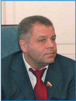
В. А. ЖИДКИХ, председатель Комиссии Совета Федерации Федерального Собрания Российской Федерации по делам молодежи и туризму