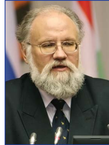
В. Е. ЧУРОВ, Председатель Центральной избирательной комиссии Российской Федерации