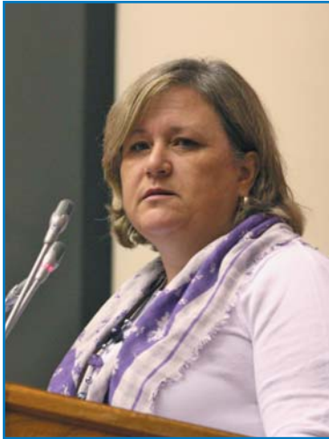
М. ПЕДЕН, глобальный координатор по случайным травмам Всемирной организации здравоохранения