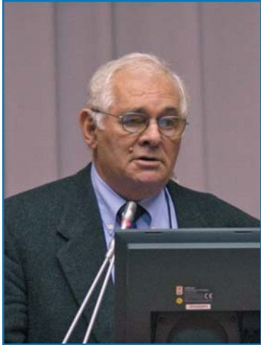
Л. М. РОШАЛЬ, директор Научно-исследовательского института неотложной детской хирургии и травматологии, президент Национальной медицинской палаты