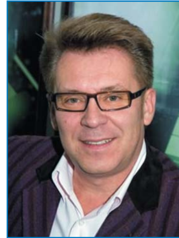
В. А. БЕРЕЗИН, народный артист Российской Федерации, член правления Добровольного общества содействия повышению безопасности дорожного движения

Уважаемые дамы и господа! Дорогие друзья!