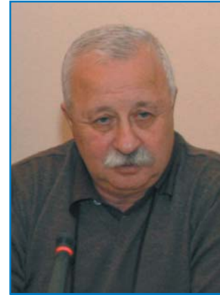
Л. А. ЯКУБОВИЧ, телеведущий, народный артист Российской Федерации