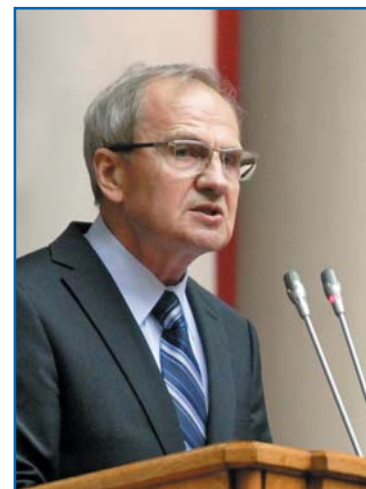
В. Д. ЗОРЬКИН, Председатель Конституционного Суда Российской Федерации