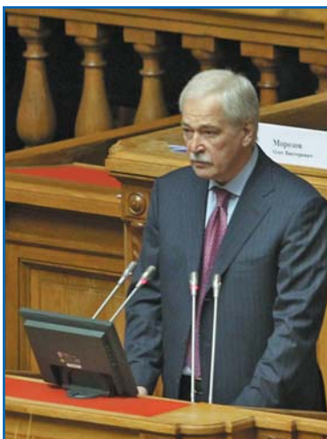
Б. В. ГРЫЗЛОВ, Председатель Государственной Думы Федерального Собрания Российской Федерации