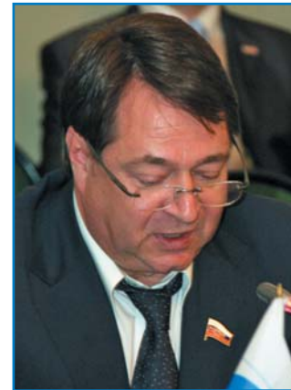
С. В. ШАТИРОВ, первый заместитель председателя Комитета Совета Федерации Федерального Собрания Российской Федерации по промышленной политике