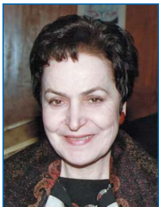
Л. А. АЛАВЕРДЯН, член Постоянной комиссии Национального Собрания Республики Армения по экономическим вопросам, член Постоянной комиссии МПА СНГ по правовым вопросам