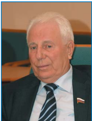
В. К. ГУСЕВ, первый заместитель председателя Комитета Совета Федерации Федерального Собрания Российской Федерации по экономической политике, предпринимательству и собственности