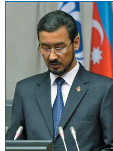
А. Р. ИБРАГИМИ, Председатель Волеси джирги Национальной Ассамблеи Исламской Республики Афганистан

В заключение позвольте от имени нашей делегации выразить благодарность оргкомитету за организацию нынешней сессии МПА СНГ на столь высоком уровне.