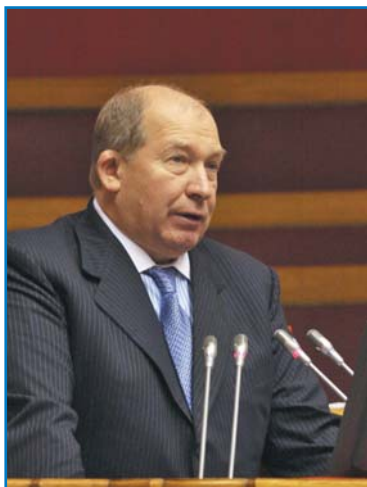
В. Н. КИРЬЯНОВ, начальник Департамента обеспечения безопасности дорожного движения Министерства внутренних дел Российской Федерации — главный государственный инспектор безопасности дорожного движения Российской Федерации