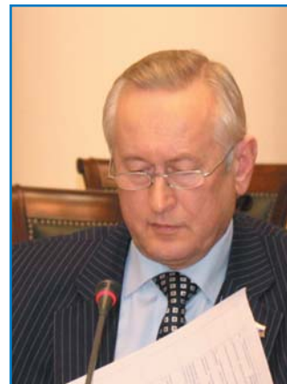
Е. Н. ТРОФИМОВ, заместитель председателя Комитета Совета Федерации Федерального Собрания Российской Федерации по социальной политике и здравоохранению