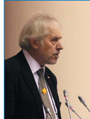
Я. ТИММЕР, глава регионального представительства Международной федерации обществ Красного Креста и Красного Полумесяца в Беларуси, Молдове, России и Украине