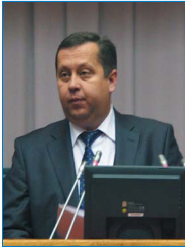
Ю. А. ЛИТВИН, начальник Управления государственной автомобильной инспекции Милиции общественной безопасности Министерства внутренних дел Республики Беларусь