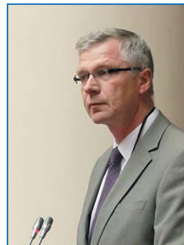
Р. НОРДЛУНД, Председатель Парламента Аландских островов (Финляндская Республика)