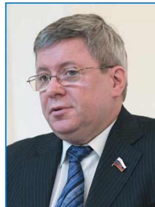
А. П. ТОРШИН, первый заместитель Председателя Совета Федерации Федерального Собрания Российской Федерации