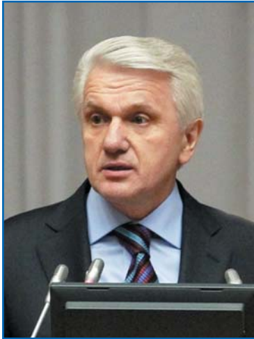
В. М. ЛИТВИН, Председатель Верховной Рады Украины, Председатель Парламентской Ассамблеи Черноморского экономического сотрудничества

Уважаемый председатель! Высокое собрание!