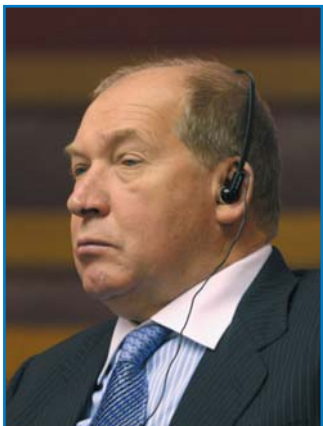
В. Н. КИРЬЯНОВ, начальник Департамента обеспечения безопасности дорожного движения Министерства внутренних дел Российской Федерации — главный государственный инспектор безопасности дорожного движения Российской Федерации