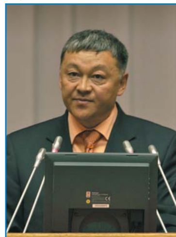
К. С. ТЫНЫБЕКОВ, председатель Комитета дорожной полиции Министерства внутренних дел Республики Казахстан

Уважаемый господин председатель! Уважаемые дамы и господа!