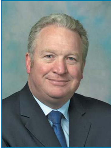
М. ПЕННИНГ, член Парламента Соединенного Королевства Великобритании и Северной Ирландии, заместитель министра транспорта Великобритании