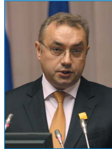
П. Б. БУНИН, президент Российского союза автостраховщиков