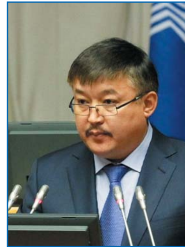
А. К. КЕЛДИБЕКОВ, Председатель Жогорку Кенеша Кыргызской Республики

Благодарю за внимание и желаю всем нам успешной работы.