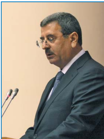
О. И. ЗАЛОВ, заместитель министра внутренних дел Азербайджанской Республики