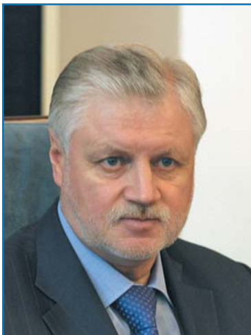
С. М. МИРОНОВ, Председатель Совета Федерации Федерального Собрания Российской Федерации, Председатель Совета Межпарламентской Ассамблеи государств — участников СНГ