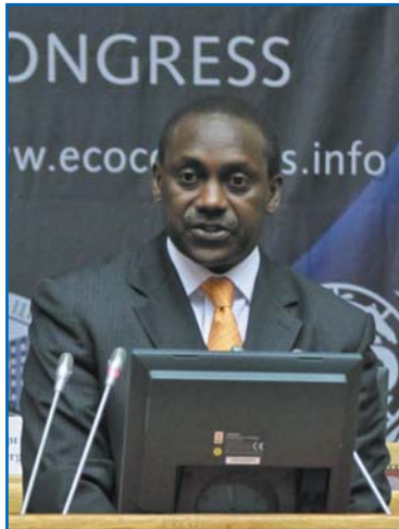
К. ЮМКЕЛЛА, генеральный директор Организации Объединенных Наций по промышленному развитию (ЮНИДО)

Уважаемый председатель! Уважаемые участники! Дамы и господа!