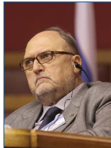
Р. МИГЛИОРИ, заместитель Председателя Парламентской Ассамблеи Организации по безопасности и сотрудничеству в Европе