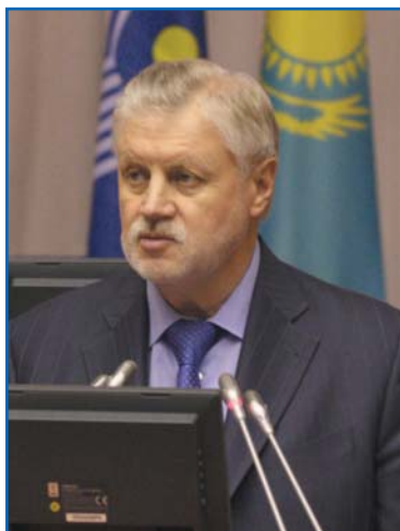
С. М. МИРОНОВ, Председатель Совета Федерации Федерального Собрания Российской Федерации, Председатель Совета Межпарламентской Ассамблеи государств — участников СНГ