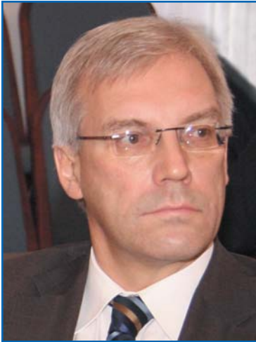
А. В. ГРУШКО, заместитель Министра иностраных дел Российской Федерации