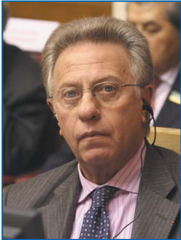
Дж. БУКИККИО, Президент Венецианской комиссии Совета Европы