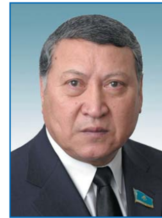
И. А. АМИРОВ, член Комитета Сената Парламента Республики Казахстан по законодательству и правовым вопросам, член Постоянной комиссии МПА СНГ по правовым вопросам

витие экономики Республики Казахстан обязательно будет успешным, если во главу угла поставить интересы народа. Нам необходимо серьезно изучать зарубежный опыт, иметь некую модель для прорыва по целому ряду направлений, требующих замены устаревших технологий на инновационные.