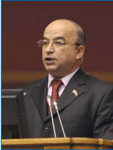
Ш. З. ЗУХУРОВ, Председатель Маджлиси намояндагон Маджлиси Оли Республики Таджикистан

Уважаемый господин председатель! Уважаемые коллеги, дамы и господа!