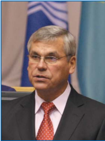
В. П. АНДРЕЙЧЕНКО, Председатель Палаты представителей Национального собрания Республики Беларусь

Уважаемый господин председательствующий! Дамы и господа!