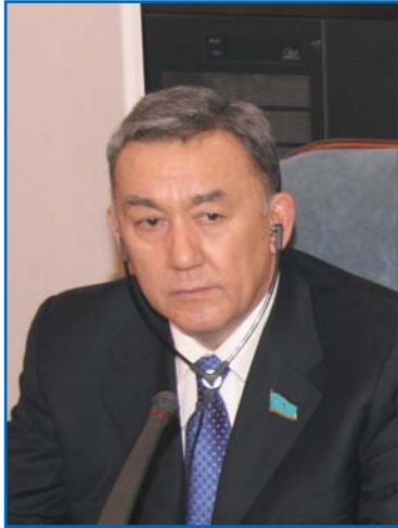
А. Р. ЖОЛШИБЕКОВ, председатель Комитета Мажилиса Парламента Республики Казахстан по международным делам, обороне и безопасности, председатель Постоянной комиссии МПА СНГ по политическим вопросам и международному сотрудничеству