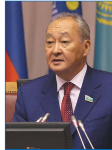
У. Б. МУХАМЕДЖАНОВ, Председатель Мажилиса Парламента Республики Казахстан