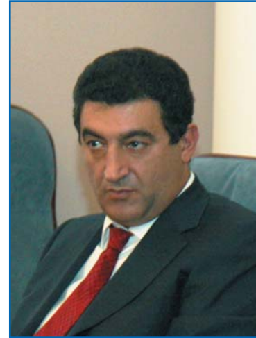
В. С. АЙВАЗЯН, председатель Постоянной комиссии Национального Собрания Республики Армения по экономическим вопросам, председатель Постоянной комиссии МПА СНГ по экономике и финансам