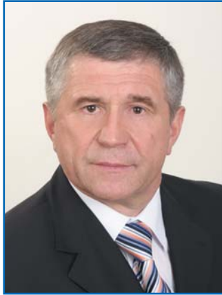
В. М. БАЙКОВ, председатель Постоянной комиссии Палаты представителей Национального собрания Республики Беларусь по государственному строительству, местному самоуправлению и регламенту, председатель Постоянной комиссии МПА СНГ по изучению опыта государственного строительства и местного самоуправления