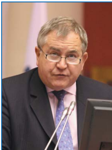
Р. УОЛТЕР, Председатель Европейской Ассамблеи по безопасности и обороне