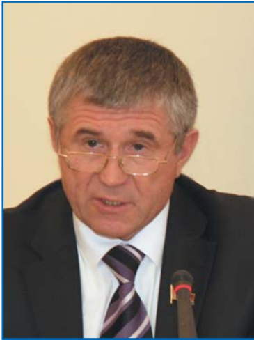
В. М. БАЙКОВ, председатель Постоянной комиссии Палаты представителей Национального собрания Республики Беларусь по государственному строительству, местному самоуправлению и регламенту, председатель Постоянной комиссии МПА СНГ по изучению опыта государственного строительства и местного самоуправления