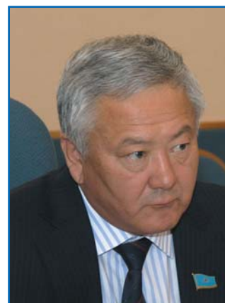
Б. О. АЛИМЖАНОВ, секретарь Комитета Мажилиса Парламента Республики Казахстан по социально-культурному развитию, член Постоянной комиссии МПА СНГ по науке и образованию

Все это обязывает депутатский корпус активно сотрудничать с зарубежными коллегами, участвуя в деятельности различных международных организаций, парламентских комиссий и групп.