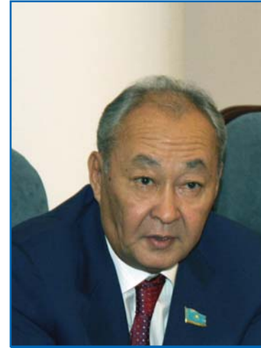
У. Б. МУХАМЕДЖАНОВ, Председатель Мажилиса Парламента Республики Казахстан