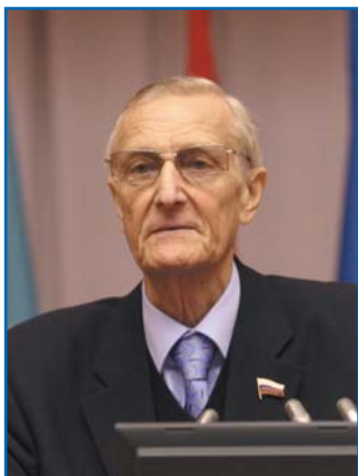
В. К. ОСИПОВ, заместитель председателя Комитета Государственной Думы Федерального Собрания Российской Федерации по науке и наукоемким технологиям