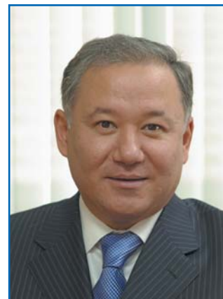
Е. З. НИГМАТУЛИН, председатель Комитета Мажилиса Парламента Республики Казахстан по вопросам экологии и природопользованию, член Постоянной комиссии МПА СНГ по аграрной политике, природным ресурсам и экологии

гово-экономического сотрудничества между Республикой Казахстан и Российской Федерацией видятся в совместной работе по реализации стратегических, «прорывных» проектов.