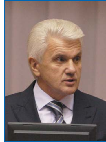
В. М. ЛИТВИН, Председатель Верховной Рады Украины

Уважаемый господин председатель! Уважаемые участники конференции! Дамы и господа!