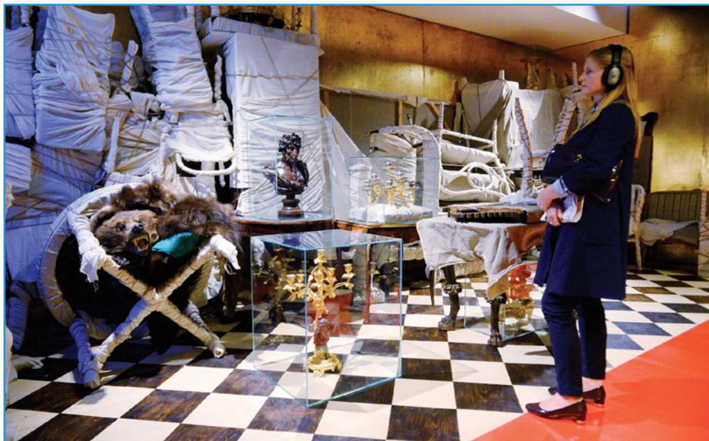
Выставка «Хранить вечно» в ЦВЗ «Манеж»

главном — на эмоциях. ЦВЗ «Манеж» открылся выставкой о Венецианской биеннале, затем было несколько значительных международных проектов: «Genii Loci (Гений места). Греческое искусство с 1930 года по сегодняшний день»; масштабная выставка современных китайских художников; целая серия проектов «Притяжение», организованных в сотрудничестве с различными крупными культурными институциями, в частности с центром современного искусства «Винзавод», с московской галереей «Триумф».