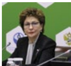
Г. Н. Карелова

Модераторы: заместитель Председателя Совета Федерации Федерального Собрания Российской Федерации Г. Н. Карелова, заместитель директора Департамента государственной политики и регулирования в области гидрометеорологии,