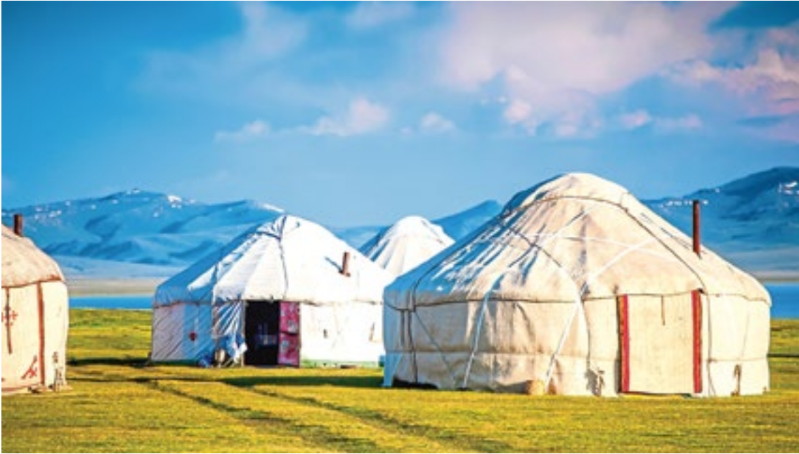
В Кыргызстане началось развитие юрточных глэмпингов