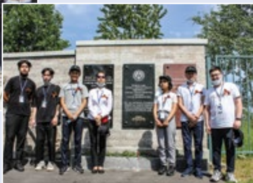
На Пискаревском мемориальном кладбище