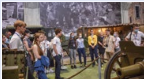
Посещение экспозиции Патриотического объединения «Ленрезерв»