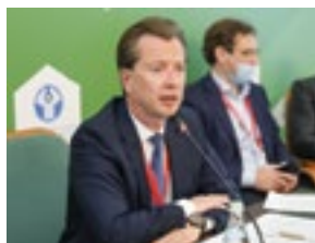
В. В. Бурматов

Модераторы: председатель Комитета Государственной Думы Федерального Собрания Российской Федерации по экологии и охране окружающей среды В. В. Бурматов, директор Главной геофизической обсерватории им. А. И. Воейкова