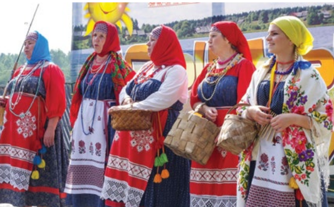
Традиционный вепский праздник «Сырный день» в деревне Сидорово Бокситогорского района Ленинградской области

сии, имеют дегустационные залы, магазины, работают и с группами, и с отдельными гостями.