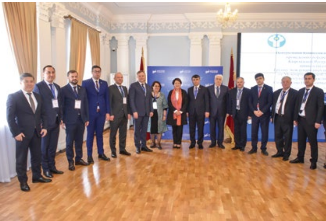
Группа наблюдателей от МПА СНГ на референдуме по проекту новой Конституции Кыргызской Республики, подготовка которого была одной из ключевых тем круглого стола