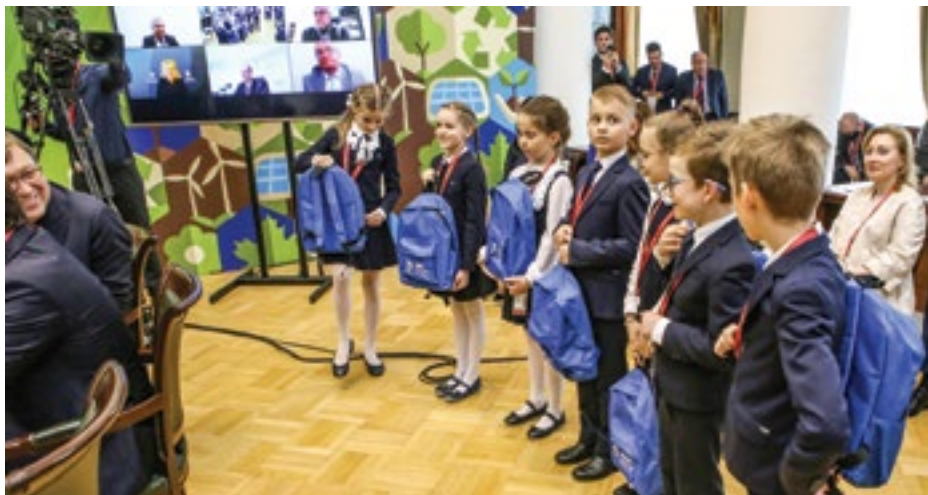
Петербургские участники проекта «Эколята» обратились к участникам круглого стола с просьбой поддержать идею проведения Всероссийского дня эколят