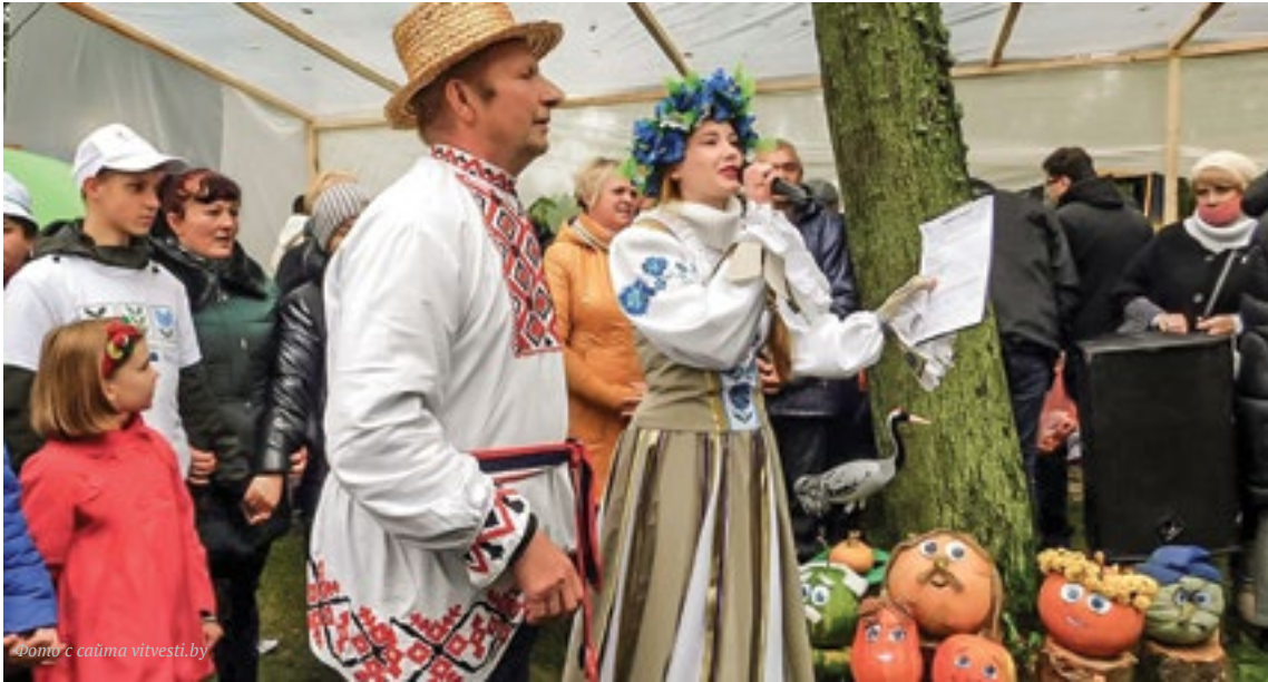
«Журавли и журавины Миорского края» — популярный в Витебской области фестиваль народного творчества

туризма. Область имеет три государственных границы, через нее проходят два транспортных европейских коридора, обеспечивая удобную связь с Москвой, Санкт-Петербургом, Ригой, Вильнюсом, Киевом. Из международных и республиканских культурных мероприятий, которые проводятся в Витебской области, можно отметить фестиваль «Славянский базар», фестивали народного творчества «В гости к лепельскому Цмоку» и «Журавли и журавины». Агроусадьбы здесь представляют различные виды услуг: экологические туры, веломаршруты, катание на лошадях и байдарках. Причем согласно Указу Президента агротуризм в Беларуси не является предпринимательской деятельностью, что позволяет закрепить людей на селе.