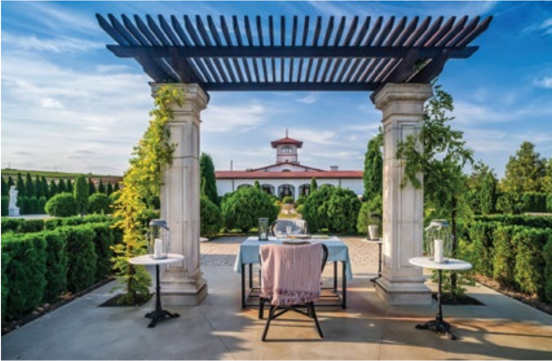
Долина Лефкадия, Краснодарский край

тирование и обучение сельских жителей для работы в сфере агротуризма. В 2006 г. на инвестиционном форуме были представлены инвестплощадки, сформированные на базе выбранных наиболее привлекательных земельных участков. Так удалось получить первых инвесторов. Среди таких площадок была знаменитая Долина Лефкадия, которая, по оценкам специалистов из Франции, напоминает ландшафты Прованса. Все основные направления национального проекта «Туризм и индустрия гостеприимства» — развитие семейного, познавательного, детско-юношеского туризма, создание соответствующей инфраструктуры — были апробированы с 2004 г. в Краснодарском крае.