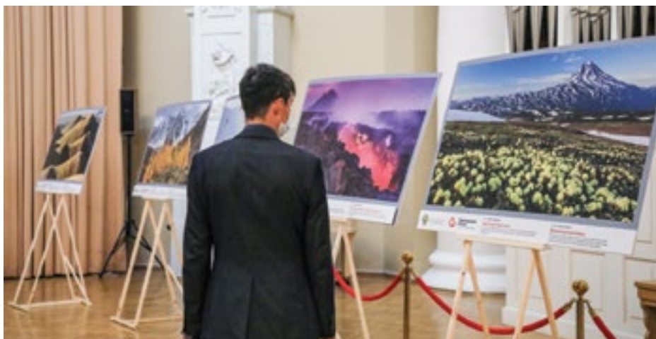
Выставка экологических фоторабот в рамках культурной программы конгресса