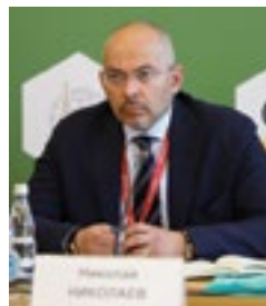
Н. П. Николаев

Модератор: председатель Комитета Государственной Думы Федерального Собрания Российской Федерации по природным ресурсам, собственности и земельным отношениям Н. П. Николаев.