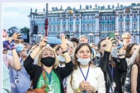
На празднике «Алые паруса»