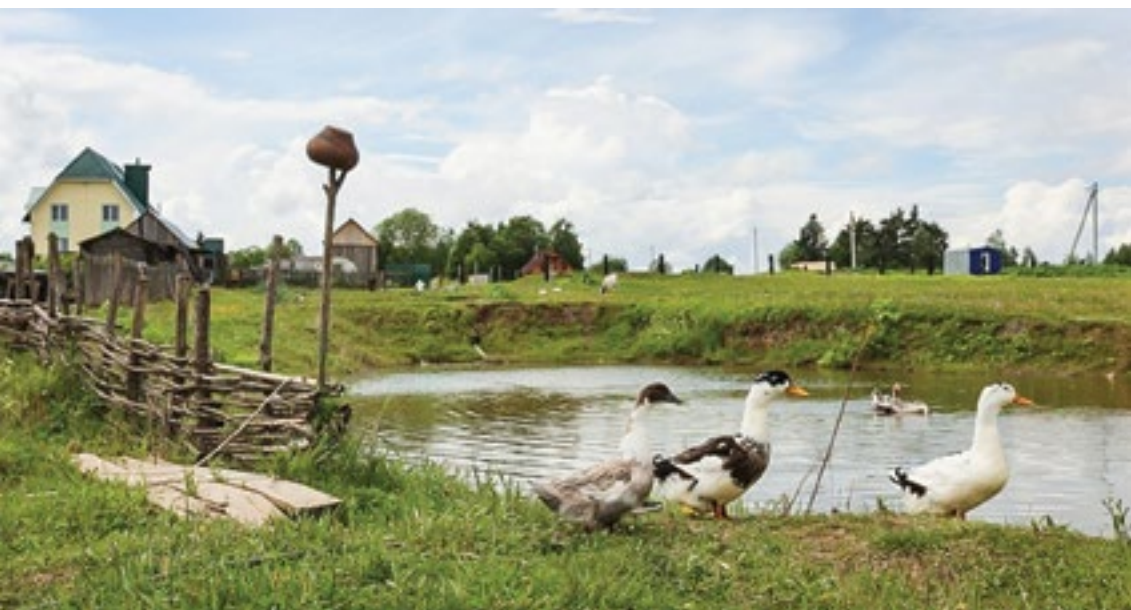
На территории гостевого комплекса «Савапиян»

строится апидомик — сооружение, позволяющее в терапевтических целях спать на ульях, в непосредственной близости от пчел, но с обеспечением защиты от их укусов. Еще одна интересная (пока не осуществленная) задумка — строительство на деревьях романтических мини-домиков для семейных пар.