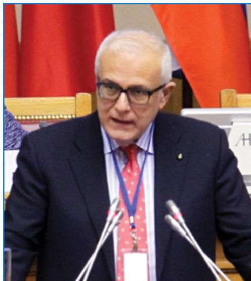
Ф. М. Аморузo

руководитель делегации Итальянской Республики в ПАС Ф. М. Аморузo , приветствуя участников пленарного заседания Межпарламентской Ассамблеи СНГ, отметил, что, хотя регионы деятельности ассамблей географически отдалены друг от друга, обе организации обеспокоены одними и теми же вызовами современности, такими как терроризм и экстремизм, незаконная миграция, изменение климата, недостаток рабочих мест для молодежи. С его точки зрения, парламентарии должны служить голосом народа и общества и в то же время обязаны контролировать действия правительств, с тем чтобы обеспечить воплощение в жизнь принятых законов и ратифицированных договоров. Кроме того, в отличие от правительств, которые чаще работают на краткосрочную перспективу, парламентарии имеют возможность продумывать действия на средне- и долгосрочную перспективы.