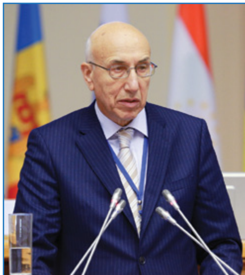
А. Г. Рагимзаде

Плана мероприятий по реализации Концепции межрегионального и приграничного сотрудничества государств — участников СНГ на период до 2020 года.