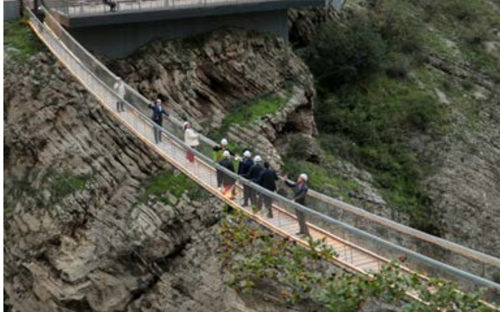
Для участников Горного форума и форума Travel Hub «Содружество» была организована экскурсия на Сулакский каньон — природную достопримечательность в долине реки Сулак — глубочайший каньон Европы и восьмой по глубине в мире

туристских территорий». Ее организаторами выступили Комитет по развитию туризма Санкт-Петербурга, АНО «Центр компетенций в сфере туризма и гостеприимства» и Конгрессно-выставочное бюро Санкт-Петербурга. На встрече обсудили острую проблему кадрового дефицита в туристической отрасли, прежде всего в сфере горного, событийного и гастрономического туризма. Для решения проблемы высокой текучести кадров было предложено расширять сеть практико-ориентированных учебных центров, обновлять программы среднего профессионального образования, повышать квалификацию преподавателей и внедрять гибкие форматы обучения. В числе ключевых инициатив — введение единых образовательных стандартов в СНГ, развитие студенческой мобильности, наставничества и международного обмена опытом. Также подчеркивалась необходимость популяризации туристических профес-