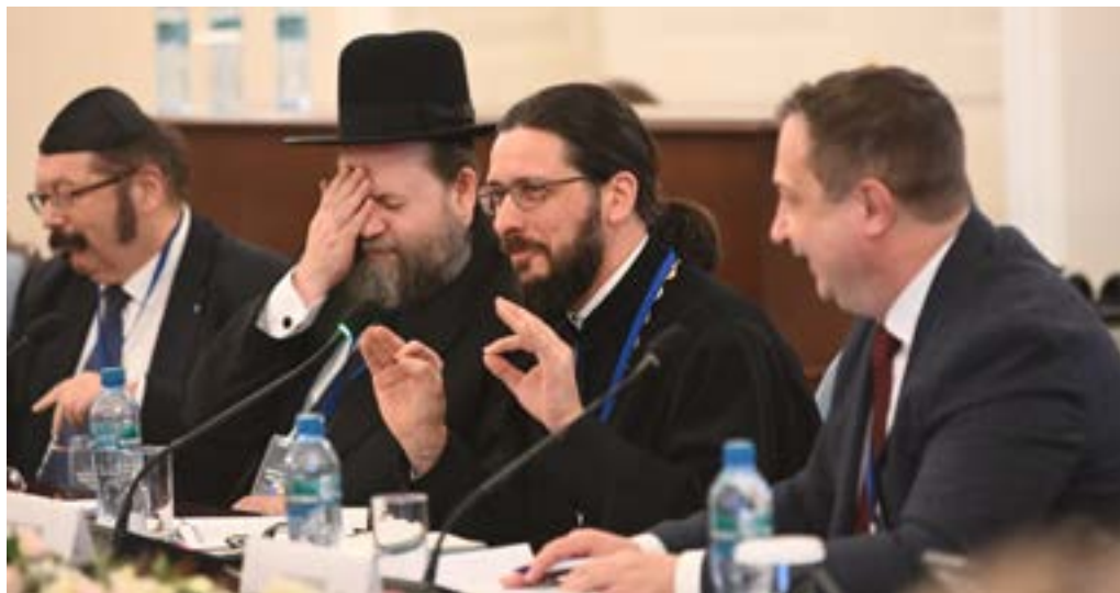
Представители традиционных для пространства СНГ конфессий приняли участие в круглом столе «Интеллектуальные коды и ценностное единство в образовательном пространстве стран Содружества»

тия инфраструктуры поддержки студенческих инициатив.