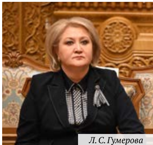
Л. С. Гумерова

■ Л. С. Гумерова, председатель Постоянной комиссии МПА СНГ по науке и образованию, председатель Комитета Совета Федерации Федерального Собрания Российской Федерации по науке, образованию и культуре, представила последний документ повестки пленарного заседания — проект Рекомендаций по нормативному регулированию академической мобильности.