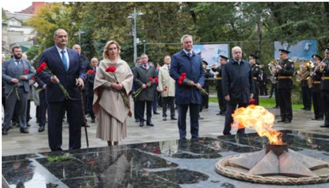
Парламентарии стран Содружества и руководство Республики Дагестан возложили цветы к памятнику Воину-освободителю и почтили память дагестанцев, павших в битвах Великой Отечественной войны

демонстрируют активный рост во всех видах туризма, в том числе в гастрономическом, медицинском и этнографическом. Интерес проявляют не только россияне, но и иностранные гости, а инвестиции в туристическую индустрию Дагестана достигли 48 млрд рублей. В ходе панельной дискуссии участники выработали ряд рекомендаций, в их числе: для органов всех уровней — принять активное участие в подготовке предложений по разработке государственной программы устойчивого развития горных территорий, использовать и развивать опыт международного права в области устойчивого развития горных территорий, обратить особое внимание на государственную поддержку сельскохозяйственной деятельности.