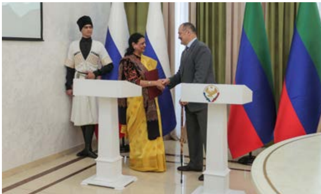
В рамках форума подписано четыре международных соглашения и меморандума о сотрудничестве

медиаконкурса для блогеров и СМИ, а также продвижение событийного туризма, агротуризма и автотуризма через готовые маршруты с культурной и гастрономической составляющими. Участники представили успешные кейсы трансграничного сотрудничества, вовлечения граждан в продвижение горного туризма. Было отмечено, что будущее отрасли — в многоформатности, цифровизации и тесном взаимодействии государства, бизнеса и общества.