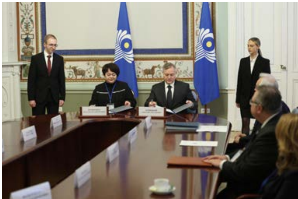
Подписание соглашения о сотрудничестве между Секретариатом Совета МПА СНГ и Российским университетом дружбы народов имени Патриса Лумумбы

На полях конференции подписаны семь соглашений о сотрудничестве МПА СНГ с другими организациями: Международной ассоциацией преподавателей русского языка и литературы, Государственным институтом русского языка имени А. С. Пушкина, Российским университетом дружбы народов имени Патриса Лумумбы, Московским государственным лингвистическим университетом, Центром международного сотрудничества Министерства просвещения Российской Федерации, Рязанским государственным университетом имени С. А. Есенина, Национальным центром исторической памяти при Президенте Российской Федерации. Также достигнута договоренность о подписании в ближайшее время аналогичных