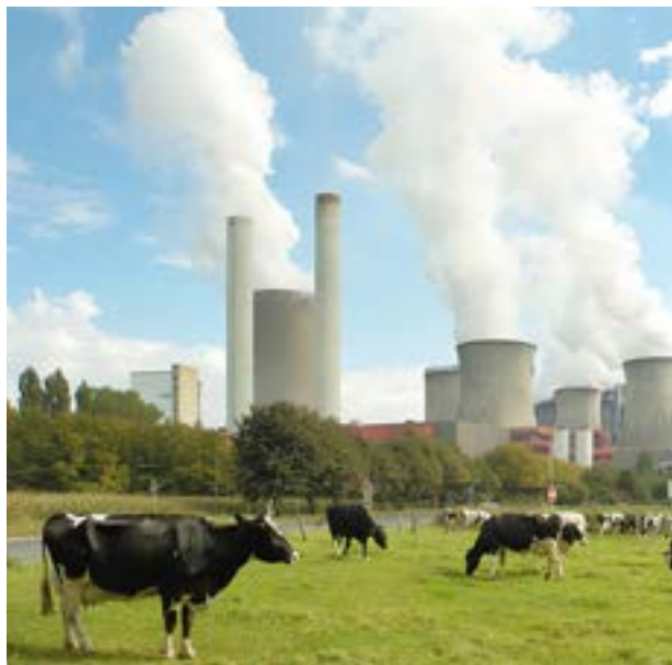
Глобальные климатические вызовы требуют скоординированных действий международного сообщества по внедрению энергоэффективных технологий