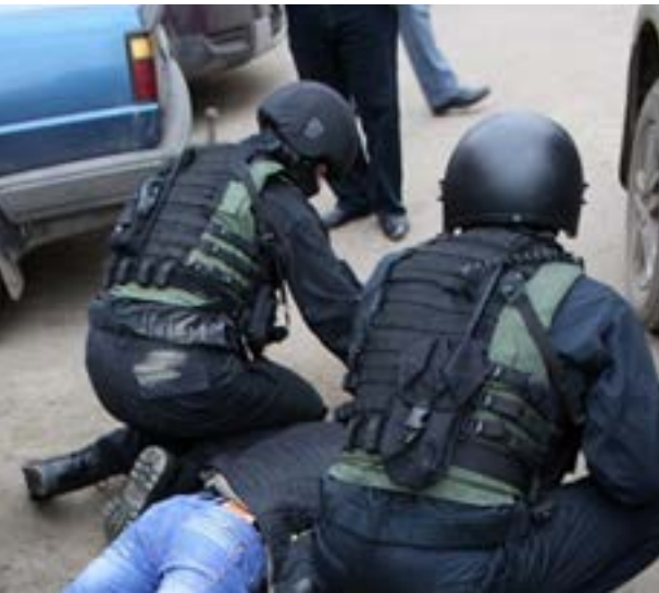
Проект изменений к модельному закону «О противодействии терроризму» предлагает снятие необоснованных ограничений для признания международных организаций террористическими