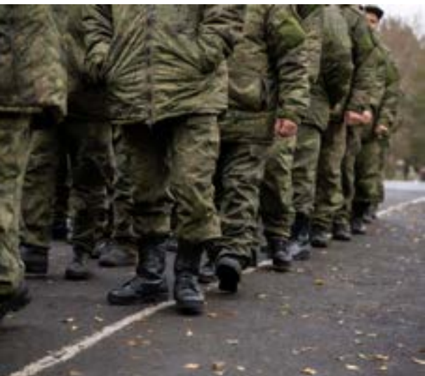
Организация территориальной обороны является частью института военного положения в большинстве стран Содружества

ционной информации и другие правовые аспекты.