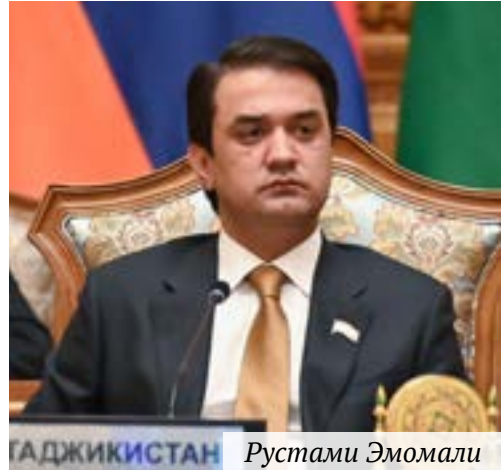
ТАДЖИКИСТАН Рустами Эмомали

Председатель Совета МПА СНГ выразила уверенность, что все намеченные планы будут успешно реализованы, и поблагодарила глав парламентов стран — членов МПА СНГ, депутатов, сенаторов за очень активную работу, за неформальный, деятельный подход к работе Ассамблеи.