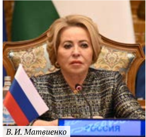
В. И. Матвиенко

80-летию Победы были посвящены прошедшие в Республике Беларусь ежегодный международный культурно-образовательный форум «Дети Содружества» и двадцать пятое заседание Молодежной межпарламентской ассамблеи государств — участников СНГ. Пользуясь случаем, Председатель Совета МПА СНГ еще раз выразила благодарность бело-