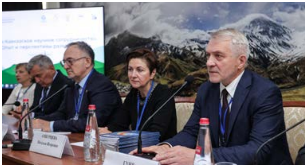
Круглый стол «Северо-Кавказское научное сообщество. Опыт и перспективы развития»

Круглый стол «От общего наследия к устойчивому будущему», организованный при содействии Базовой организации государств – участников СНГ по вопросам обращения с отработавшим ядерным топливом, радиоактивными отходами и вывода из эксплуатации ядерно- и радиационно-опасных объектов – АО «ТВЭЛ», был посвящен реабилитации территорий, пострадавших от радиоактивных отходов. Были подняты такие темы, как обеспечение устойчивости результатов рекуль-