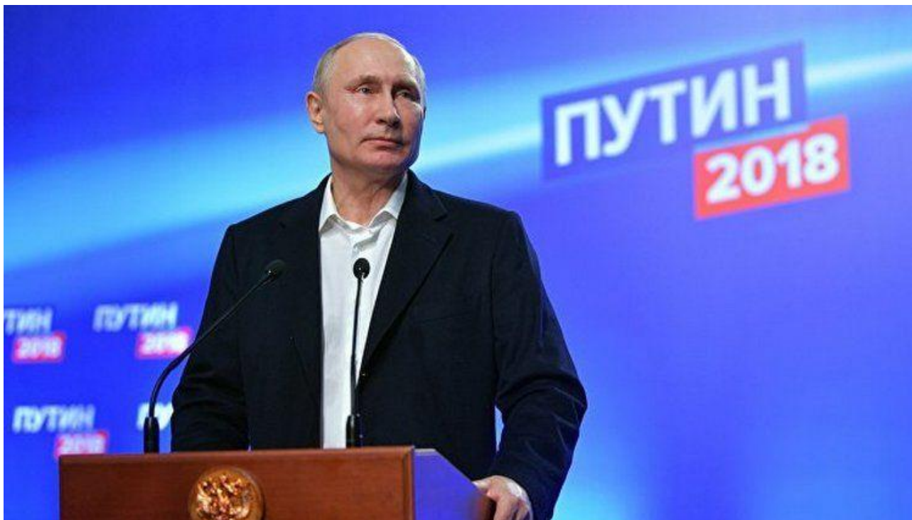
Владимир Путин сделал заявление по итогам выборов

Владимир Путин набирает свыше 76,65 процента голосов на выборах президента России по итогам обработки 99 процентов бюллетеней. Об этом сообщило РИА «Новости» со ссылкой на данный ЦИК РФ.