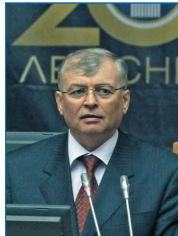
Н. В. ПОПОВ, статс-секретарь — заместитель министра природных ресурсов и экологии Российской Федерации