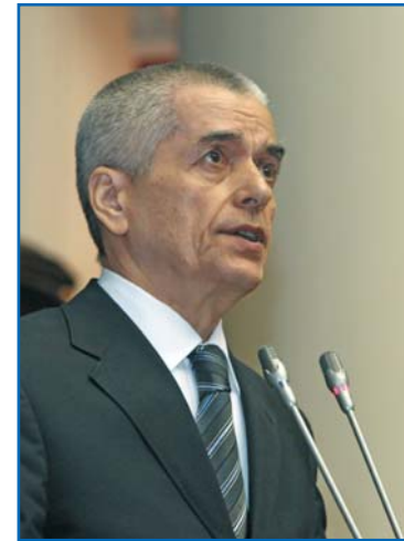
Г. Г. ОНИЩЕНКО, руководитель Федеральной службы по надзору в сфере защиты прав потребителей и благополучия человека Министерства здравоохранения и социального развития Российской Федерации

Глубокоуважаемые президиум, высокое собрание!