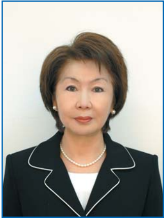
С. Ж. ДЖАЛМАГАМБЕТОВА, член Комитета Сената Парламента Республики Казахстан по социально-культурному развитию, член Постоянной комиссии МПА СНГ по культуре, информации, туризму и спорту