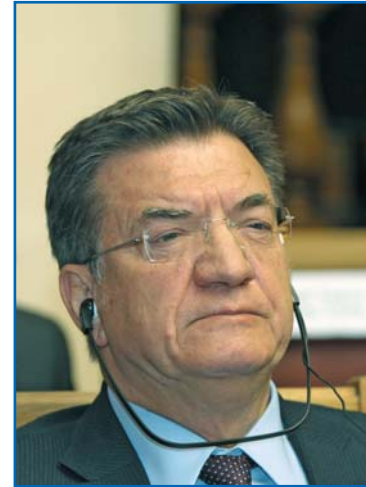
П. ЭФТИМИУ, Председатель Парламентской Ассамблеи Организации по безопасности и сотрудничеству в Европе