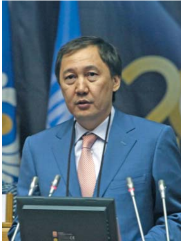
Н. С. АШИМ, министр охраны окружающей среды Республики Казахстан