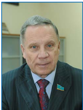
В. А. НЕХОРОШЕВ, член Комитета Мажилиси Парламента Республики Казахстан по вопросам экологии и природопользованию, член Постоянной комиссии МПА СНГ по аграрной политике, природным ресурсам и экологии