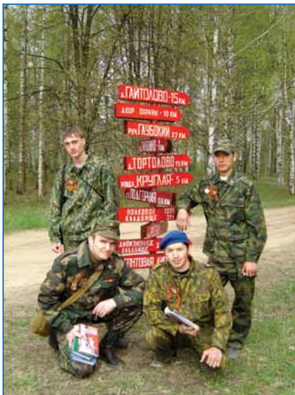
4 мая 2008 г. После установки указателя маршрутов мемориальной зоны «Надежда»

Волховского фронта. На бетонном столбике, вкопанном на холме братской могилы, были написаны девять имен, установленных по смертным медальонам. Со временем холм могилы просел и зарос травой, а столбик, уже без надписей, завалился. Спустя еще некоторое время ничто не напоминало о том, что у «Скорбящего матроса» была братская могила, — типичный пример утери воинского захоронения, но уже не военного времени, а мирного.