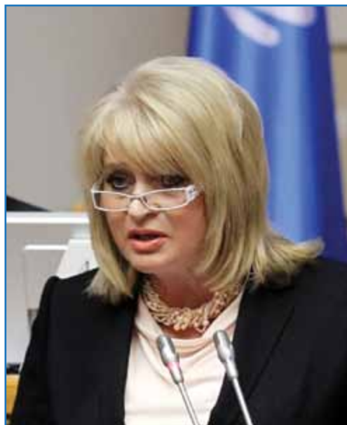
А. Ю. Манилова

Заместитель Министра культуры Российской Федерации А. Ю. Манилова отметила, что объявление 2014 г. Годом туризма в Содружестве Независимых Государств ясно говорит о нацеленности стран Содружества на ускоренное развитие туристской индустрии в интересах национальных экономик. Туризм является мощным фактором активизации международного сотрудничества, культурного взаимообогащения народов. Лучшего моста между странами и людьми, чем культура и туризм, человечество еще не придумало. И это — общий фундамент в построении единого туристского пространства СНГ, общий фундамент для всех стран Содружества.