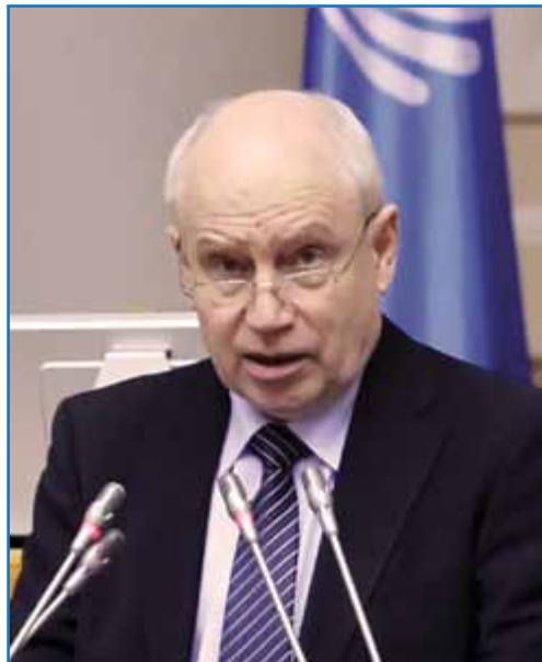
С. Н. Лебедев

Председатель Исполнительного комитета — Исполнительный секретарь Содружества Независимых Государств С. Н. Лебедев приветствовал участников сорок первого пленарного заседания Межпарламентской Ассамблеи государств — участников СНГ от имени Исполнительного комитета Содружества Независимых Государств.