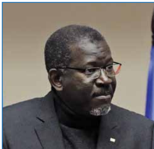
Э. А. Си

СНГ и Совета глав правительств СНГ, состоявшихся 10 октября и 21 ноября 2014 г. соответственно. В числе других Совет глав государств СНГ рассмотрел вопрос о роли Межпарламентской Ассамблеи государств — участников СНГ в развитии межрегионального сотрудничества. Главы государств одобрили представленную информацию и поддержали совместную инициативу Межпарламентской Ассамблеи и Исполнительного комитета СНГ по организации Форума регионов государств — участников СНГ в 2016 г. Совет МПА СНГ заслушал информацию о первых шагах по подготовке форума, ознакомился с проектом его концепции, принял решение о формировании организационного комитета.