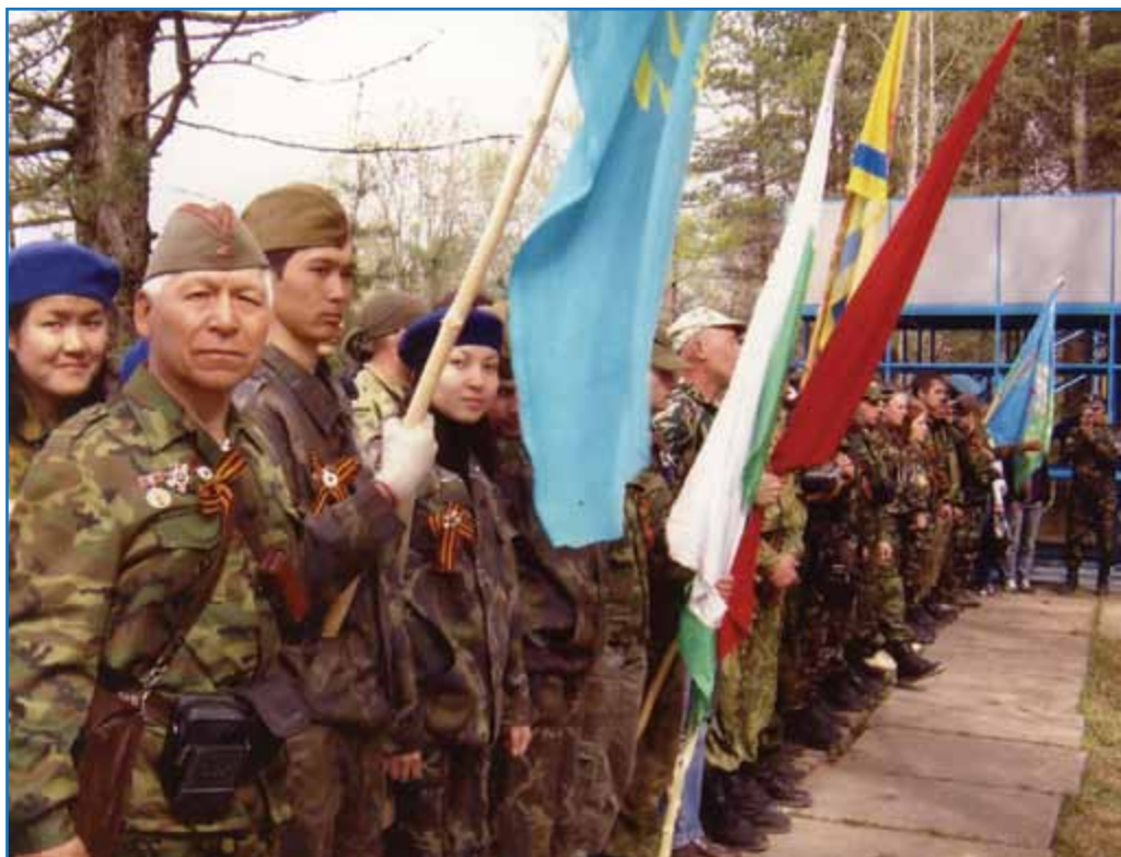
9 мая 2009 г. Траурный митинг на Синявинских высотах

установил новые обелиски, используя привезенные из Казахстана металлические элементы.