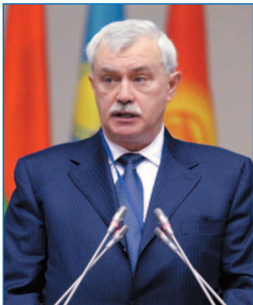
Г. С. Полтавченко

парламентской Ассамблеи осуществляется в соответствии с утвержденными планами: разработан 31 модельный документ, 11 из них приняты на сорок втором пленарном заседании МПА СНГ, весной 2015 г., 20 документов должны быть рассмотрены на текущем заседании, причем пять из них имеют непосредственное отношение к основному вопросу заседания — о миграции. Информация о правовом обеспечении миграционных процессов в Содружестве была рассмотрена 16 октября 2015 г. Советом глав государств СНГ, который одобрил ее и поручил Межпарламентской Ассамблее продолжать работу.