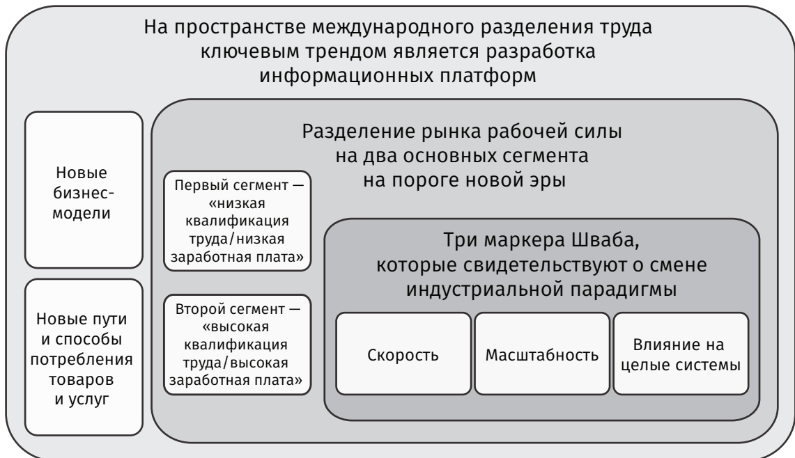
Рис. 2. Глобализация мирового экономического пространства: «мы на краю новой технологической революции»

Технология является одним из главных факторов в пространстве международного разделения труда. Ярче всего она проявится в странах с развитой промышленностью. Однако в глобальной экономике последствия новой промышленной революции распространятся далеко за пределы промышленно развитого мира. Технология является одним из