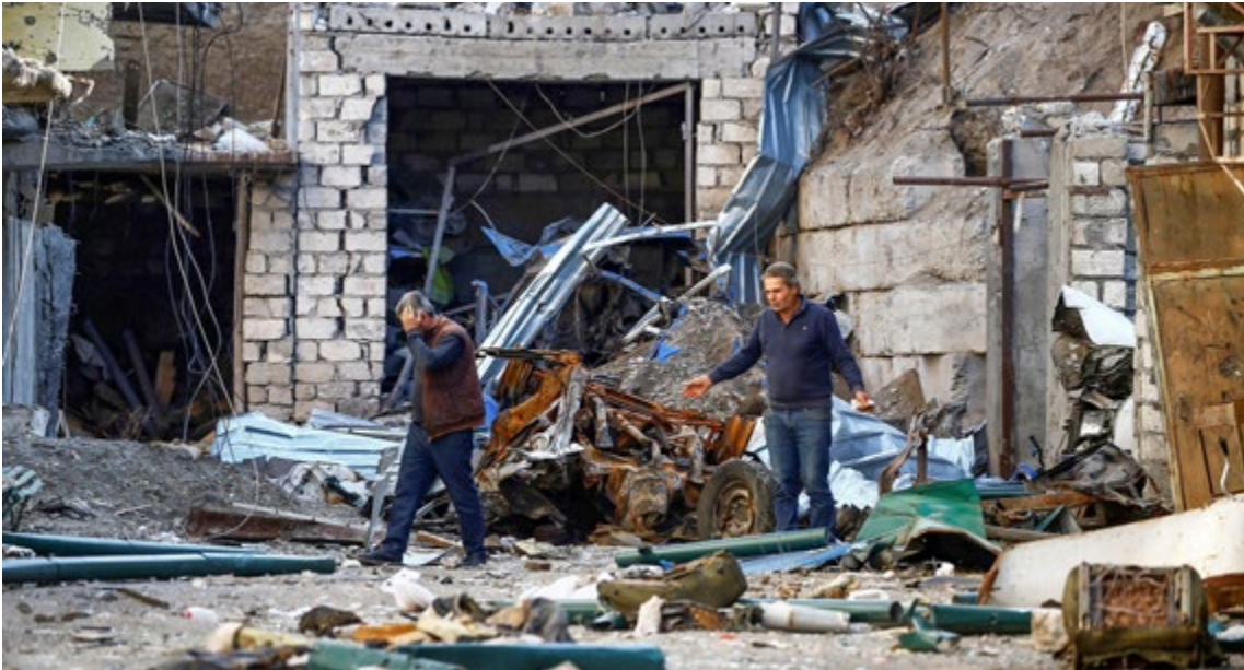
Нагорный Карабах. Последствия обострения конфликта

Бостонском марафоне и двадцатой годовщине теракта 11 сентября. В связи с этими датами в ООН запланирован целый ряд мероприятий, в том числе глобальный конгресс жертв терактов, который позволит осветить их проблемы на международном уровне. Международный день солидарности с жертвами (21 августа) должен сплотить мировое сообщество в противостоянии терроризму. В настоящий момент готовится отчет Генерального секретаря ООН, посвященный защите прав пострадавших от террористических атак.