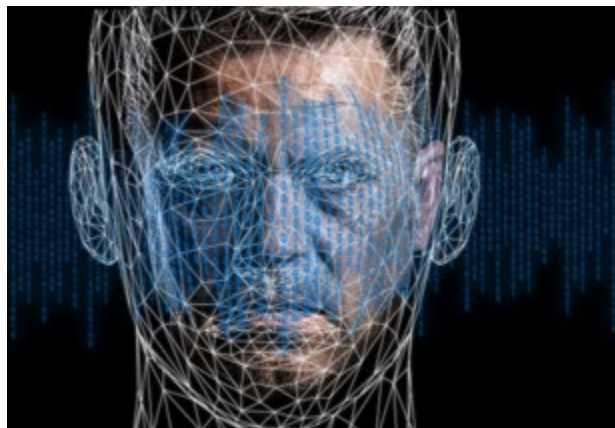
Использование технологий deep fake становится новым источником угроз для общества

Докладчик предложил пойти по пути внесения в доктрину информационной безопасности соответствующих изменений, подробно разбирающих угрозы, исходящие от технологий искусственного интеллекта. На основе доктрины, на его взгляд, можно было бы разрабо-