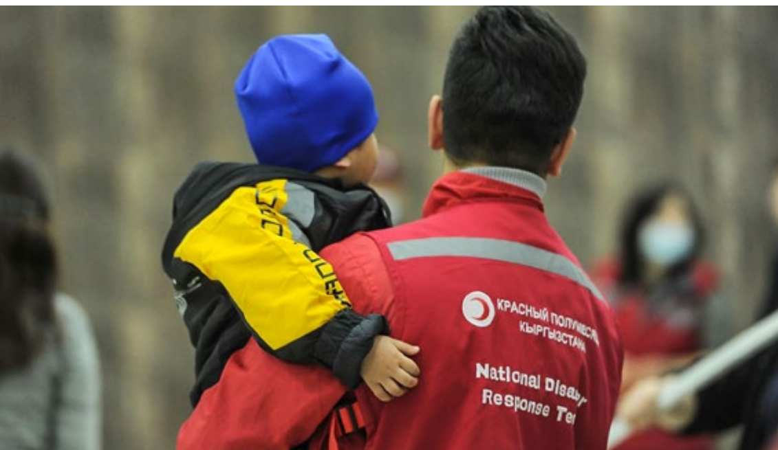
Центральноазиатские страны СНГ реализуют программы по возвращению домой членов семей лиц, ставших боевиками в Ираке и Сирии

мент соответствующим службам предстоит работа по проведению реабилитации детей для дальнейшей передачи родственникам. Вывоз детей осуществлен с согласия их матерей, оставшихся в Ираке, и волеизъявления родственников в Кыргызской Республике принять детей на воспитание.