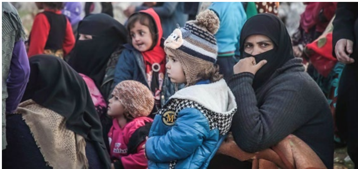
Возвращение к нормальной жизни членов семей участников незаконных вооруженных формирований — одно из ключевых направлений профилактики терроризма

интернациональный центр по изучению терроризма и борьбе с ним для укрепления международной работы в этом направлении.