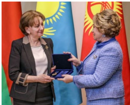
В. И. Матвиенко вручает орден «Содружество» Председателю Парламента Республики Молдова З. П. Гречаный

ших союзных республик, по итогам которой была подписана Декларация в связи с созданием Содружества Независимых Государств, состоялась в Алматы в декабре 1991 г. по инициативе первого Президента Республики Казахстан Н. А. Назарбаева. Алма-Атинская декларация стала судьбоносным документом, заложившим основу всестороннего сотрудничества стран Содружества. СНГ содействовало решению серьезнейших политических и экономических проблем на постсоветском пространстве. Организация способствовала становлению независимых государств, развитию исторически сложившихся связей между народами.