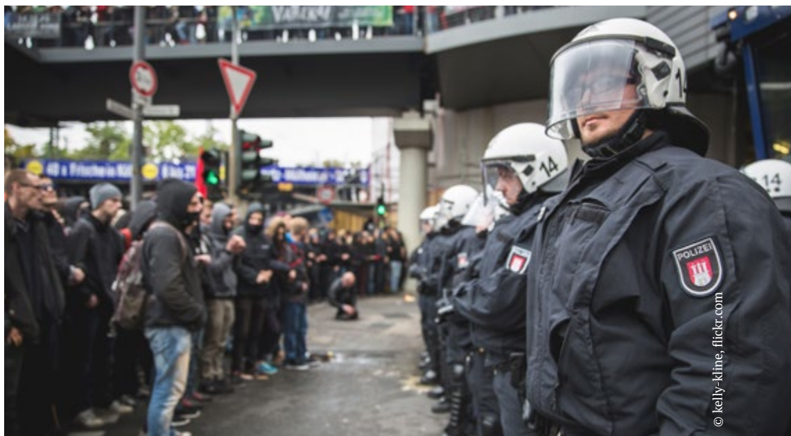
Пандемия проверяет на прочность системы государственного управления в самых разных странах мира