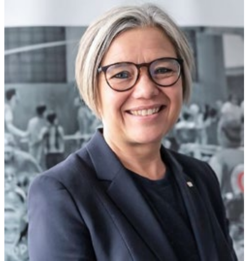
Б. Бишофф Эббезен

В 2020 г. из-за ограничений (юридических, экономических и т.д.) во многих случаях страны не могли предоставить мигрантам должного доступа к медицинским услугам. Докладчик выразила сожаление, что часто это вызвано бюрократическими