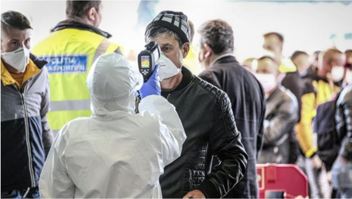
Растущее число мигрантов и беженцев в условиях пандемии создает дополнительные проблемы в принимающих и транзитных странах

с делегацией Ассамблеи в Женеве, на международном форуме по вопросам беженцев, а также о сотрудничестве по линии Красного Креста с Исполкомом СНГ и проведении успешных конференций (например, в Минске).