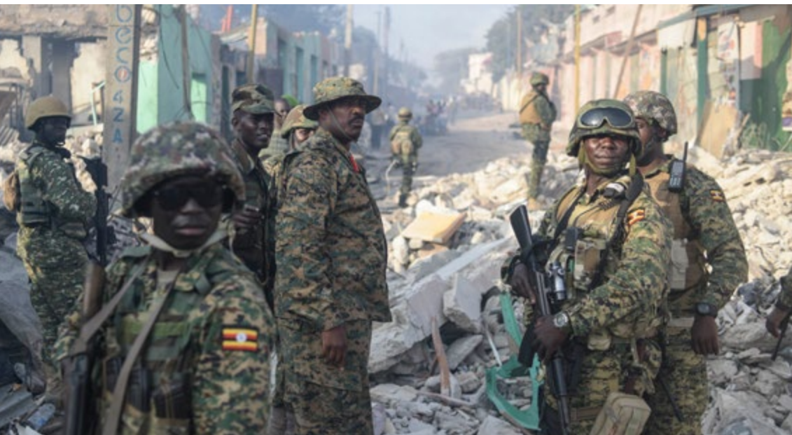
В последнее время одним из центров распространения терроризма становится Африка