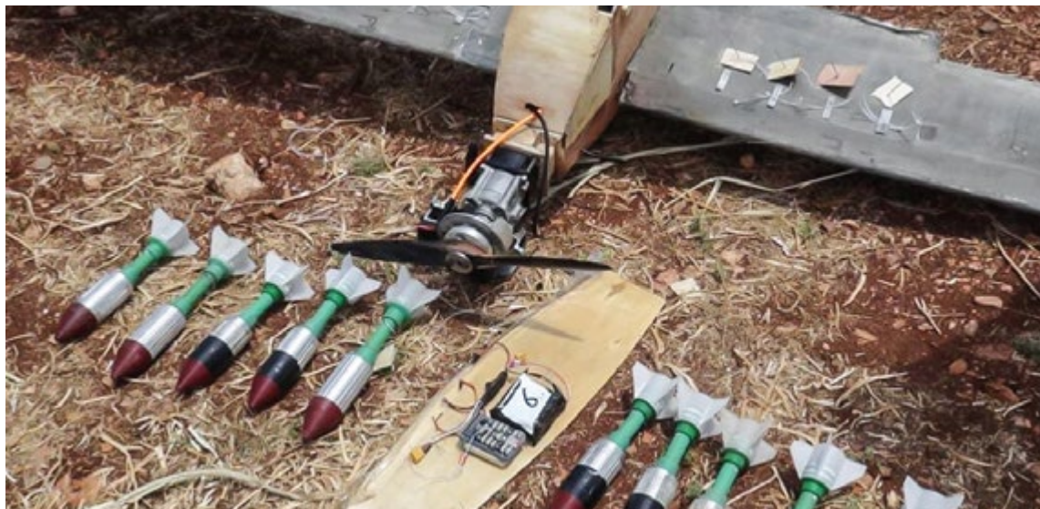
В последние годы участилось применение террористами для совершения своих атак кустарно произведенных беспилотных летательных аппаратов

возможностей децентрализованных сетей, а также специализированных приложений и браузеров с внедренными технологиями шифрования и анонимизации, позволяющих легко обходить системы фильтрации интернет-контента. Для гарантированного обеспечения своей безопасности международные террористические организации внимательно отслеживают технологические новинки, что позволяет бандитам оперативно менять скомпрометировавшие себя программные средства, а также разрабатывать собственные приложения. В качестве отдельного способа замаскированной связи докладчик выделил применение средств коммуникации, реализованных в сетевых компьютерных играх, позволяющих скрыть подлинный смысл информационного обмена.